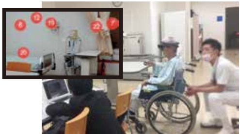
高次脳機能障害改善リハビリアプリ(作業療法) 従来は作業療法士と患者様が1対1で、紙と鉛筆で行ってきた「注意障害改善」のリハビリ。この前近代的なスタイルに風穴を開けるのが当アプリです!Hololensの複合現実機能で、より立体的、実証的かつ科学的な療法が可能になります。